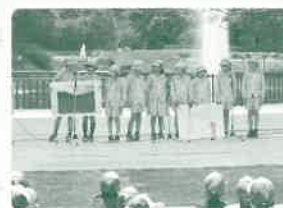
長野県みどりの少年団交流集会