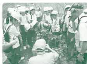
緑の募金公募事業